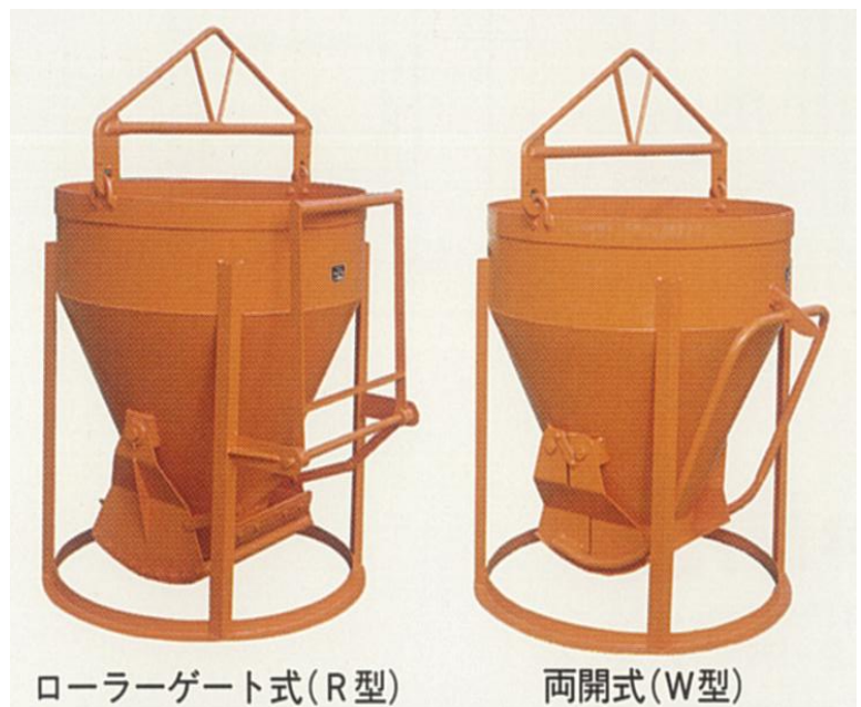
ローラーゲート式(R型)