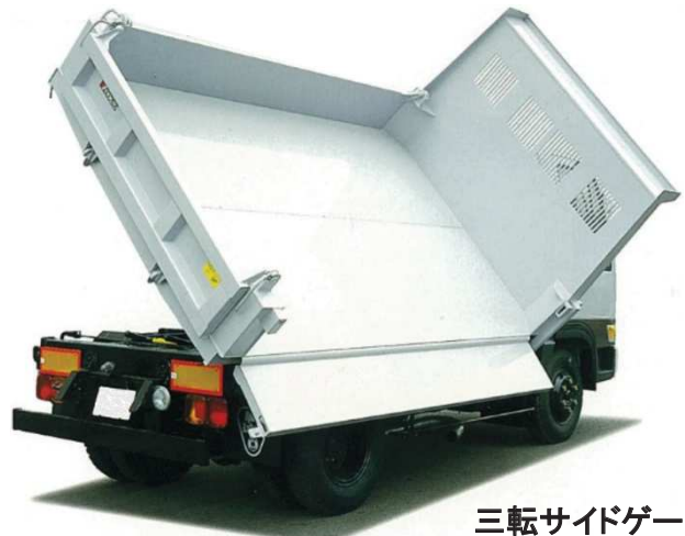
三転サイドゲート